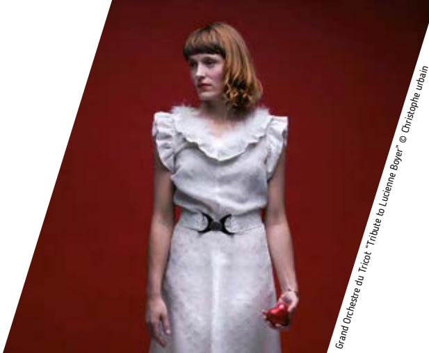
Grand Orchestre du Tricot "Tribute to Lucienne Boyer"