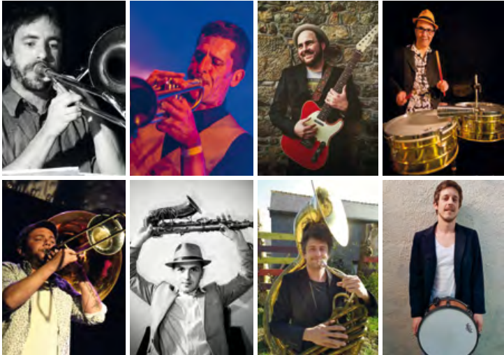
Nola Rennes Experience