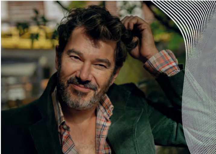
Ensemble Art Sonic