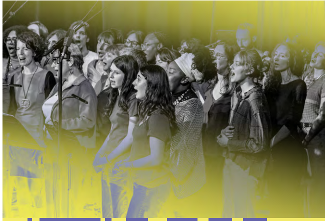
AVEC JAZZ À TOURS

Liste des musicien·nes sur petitfaucheur.fr