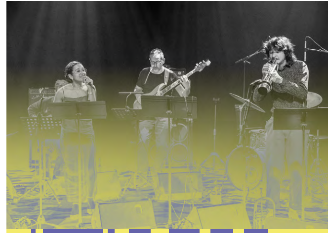
ORGANISÉ PAR JAZZ À TOURS ET LE CONSERVATOIRE À RAYONNEMENT RÉGIONAL FRANCIS POULENC DE TOURS

Les élèves présenteront leurs projets, leurs idées et leurs créations, dans un esprit ouvert et pleinement tourné vers la scène.